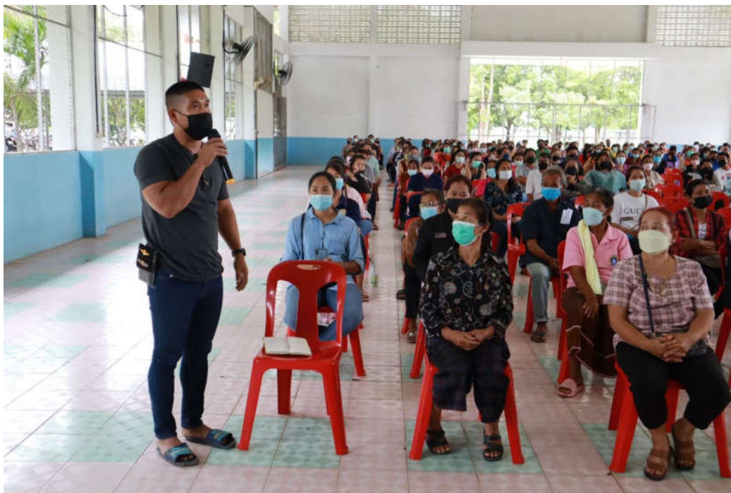
การดำเนินการแลกเปลี่ยนร่วมกันระหว่างโรงเรียนและผู้ปกครอง