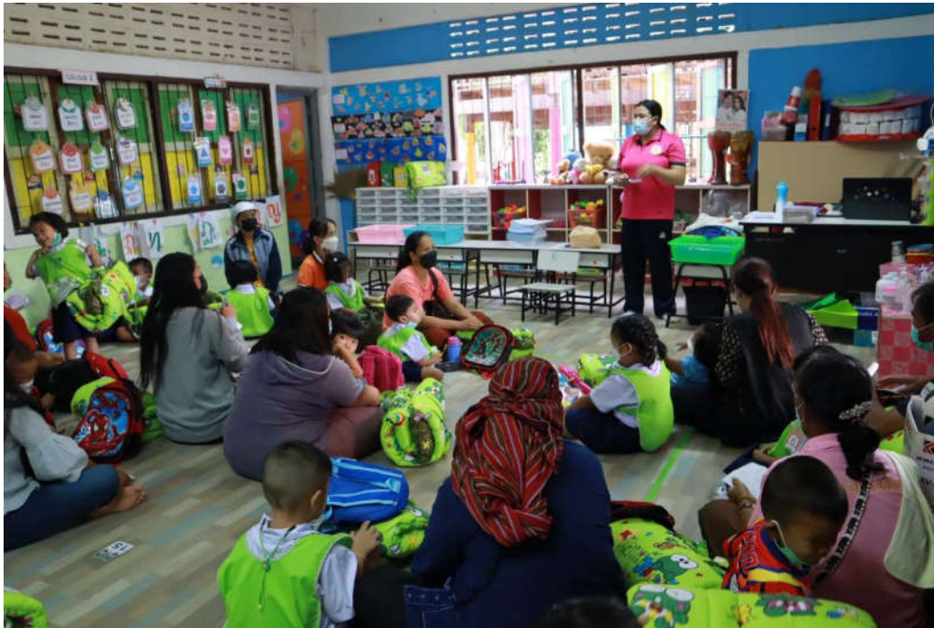
การประชุมผู้ปกครองแยกตามห้องเรียนกับครูประจำชั้น