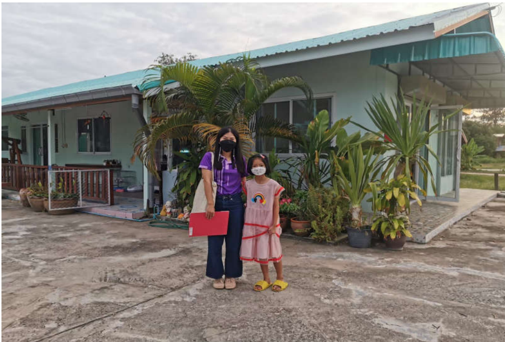
การคัดกรองทุนนักเรียนและการเยี่ยมบ้านนักเรียนเพื่อรับฟังความคิดเห็นจากผู้ปกครอง