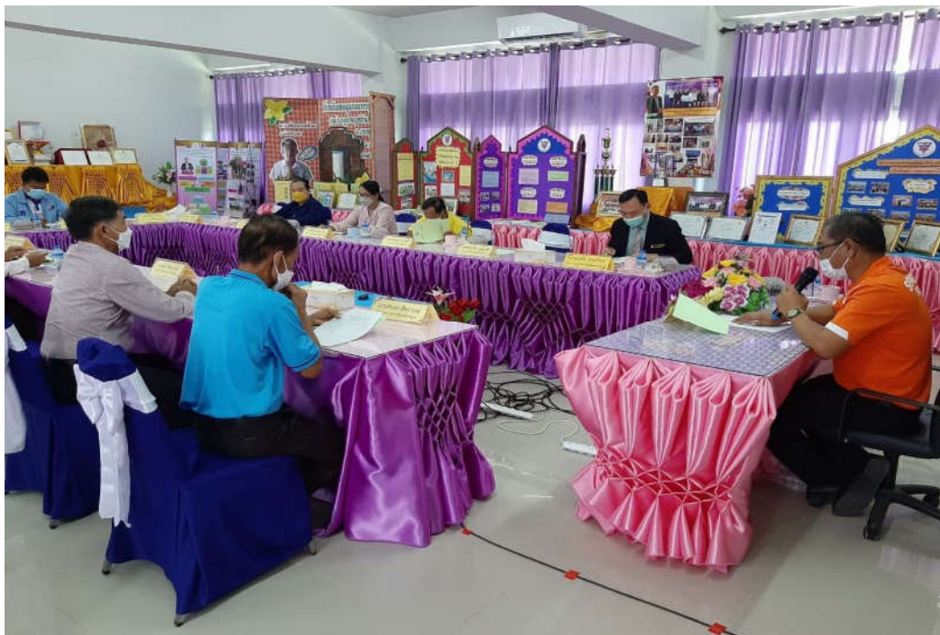
การประชุมคณะกรรมการสถานศึกษาเพื่อแลกเปลี่ยนความคิดเห็นเกี่ยวกับการบริหารสถานศึกษา